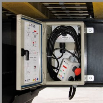
Pilot sterujący mechanizmem ruchomej podłogi