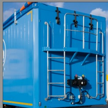
Pomost inspekcyjny wraz z drabinką