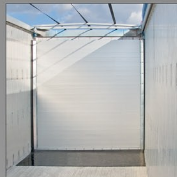
Z ruchomą podłogą podczas rozładunku może współpracować płyta wypychająca